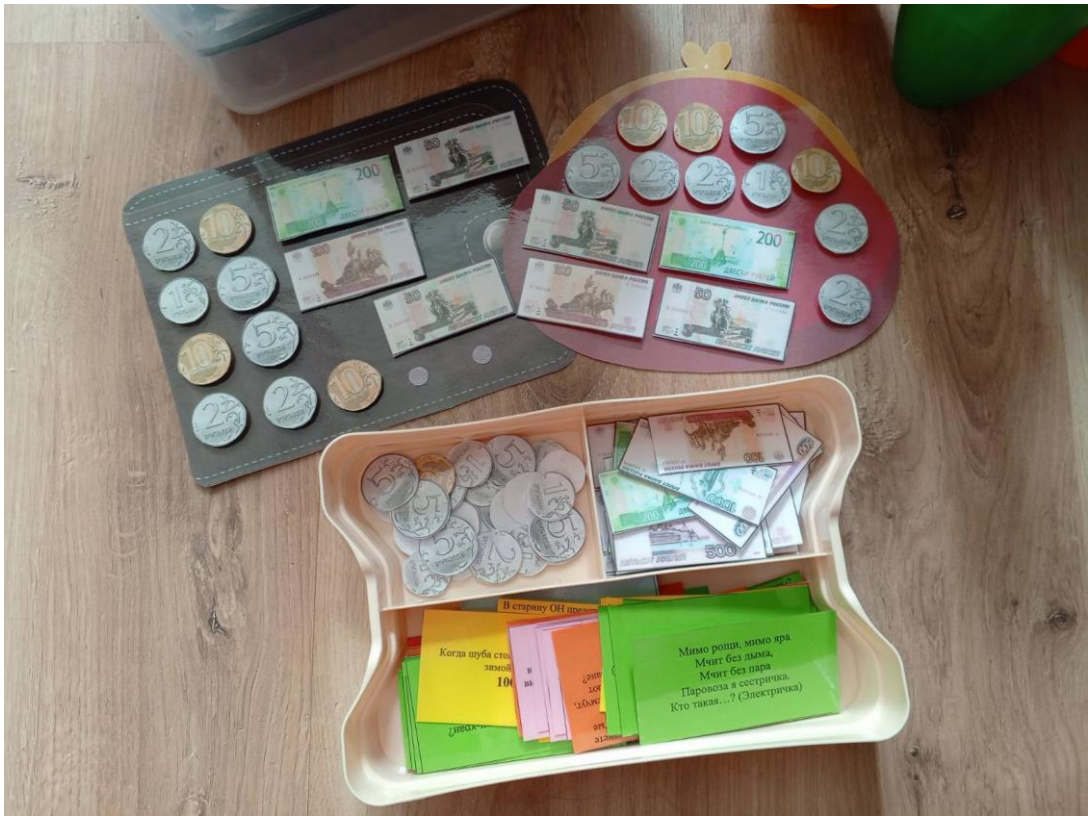
Кошельки для мальчика или девочки, коробка с монетами, банкнотами и цветными карточками с заданиями