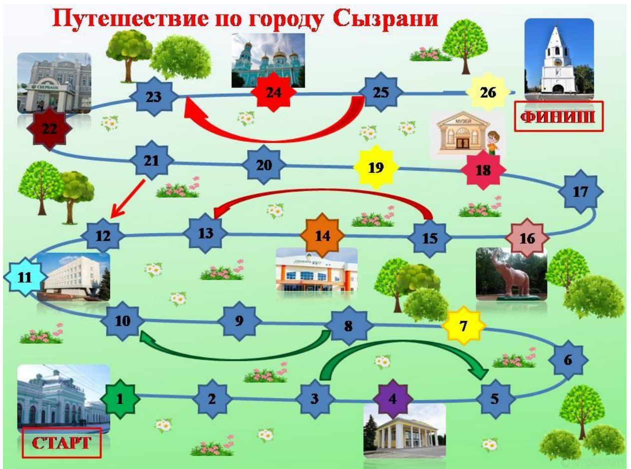
Баннер размером 1,5 м на 2,20 м